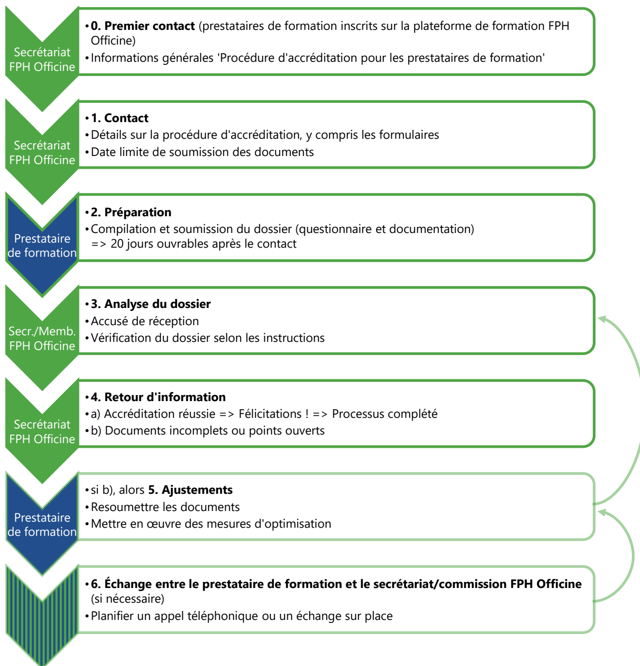
Figure 2: Déroulement de l'accréditation des prestataires de formation 2

Un dossier doit être soumis pour l'accréditation des prestataires de formation. Celui-ci comprend les documents suivants: